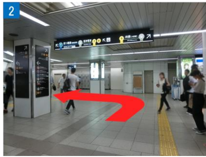
② 突き当りを左へ曲がります。