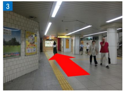
③ クロストの赤いゲートが見えます。