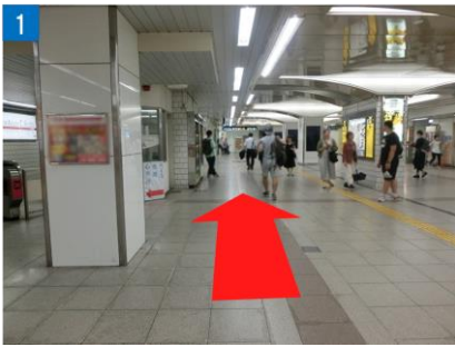
① 中北東改札、中北西改札、中南改札いずれかの改札を出て、阪急百貨店側を背に直進します。