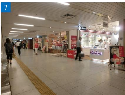
⑦ クロストの店舗が並んでいます。