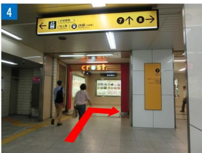
④ クロストのゲートを抜けて、右へ曲がります。