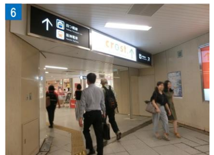
⑥ クロスト（御堂筋線側）に到着します。